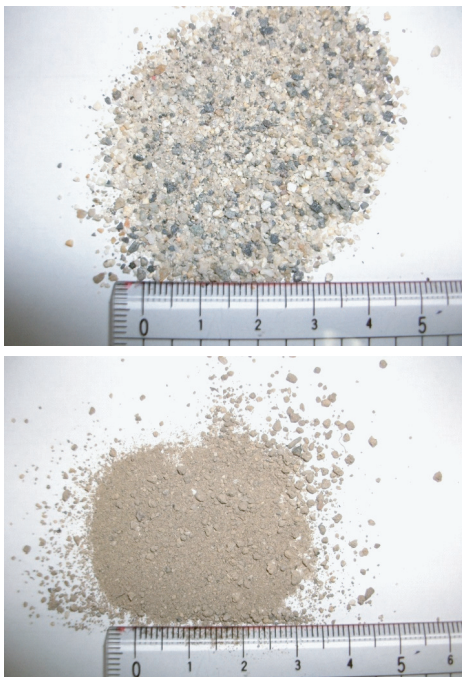
図4. 実験に用いた土. A: 礫を多く含むグラウンドの土. B: 泥を多く含む植木の根元の土.

植木の根元の土を流すと, 水は濁るが土が堆積してできる地層には級化がみられる. 多少濁るが地層の観察は可能である. また, 水が透明に近くなるまでには1週間かかった.