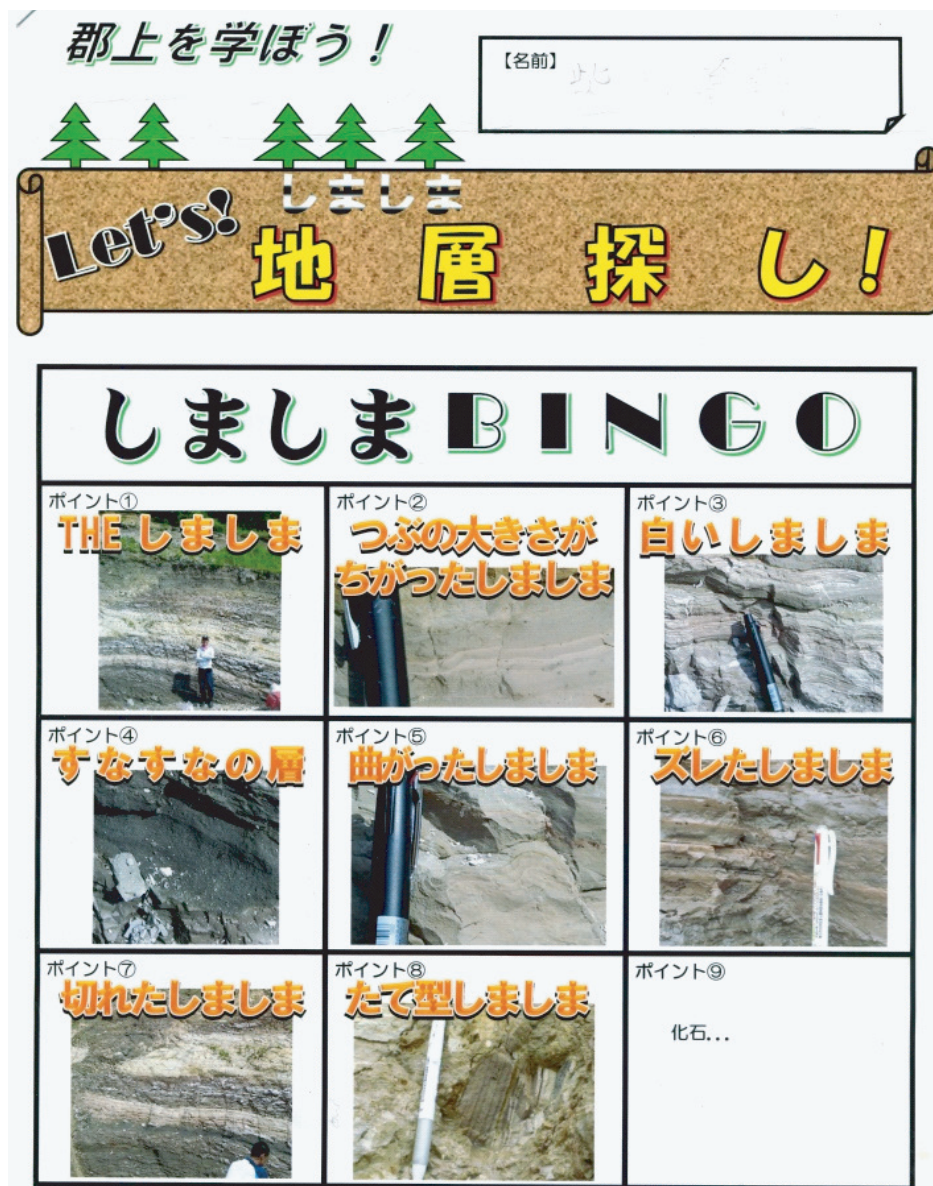
図2. 児童に配布したワークシート.

ンド（高さ35cmに固定）である。これは理科の教科書（新しい理科6（東京書籍））を参考にした。1Lのペットボトルが“湖”，雨どいが“川”，スタンドが“山”のモデルとした。ペットボトルに水をため、装置を組み立て、雨どいを伝わせて水とともに土を流し込むことで、ボトルの底に土が積もり、地層ができるという仕組みになっている。また、実験はグループごとに分かれて行うが、実験自体は一人に1セット用意した。本研究で、1Lのペットボトルを使用して、繰り返し土を流し込んだ際に地層が厚く積み重なるようにした。