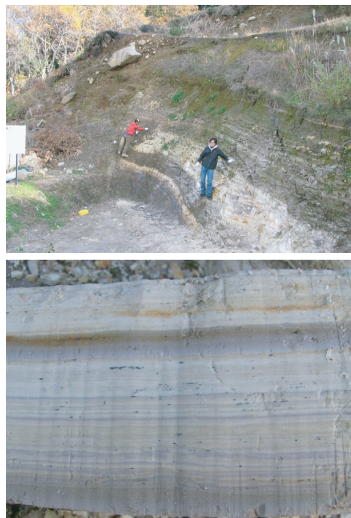
図1. 阿多岐層の露頭(a)と、縞模様の発達した珪藻土(b)。露頭の黒っぽい層は凝灰質砂層。

地域では、第四紀の更新世前期(約150万年～100万年前)に形成された烏帽子岳火山岩類が分布し、その周辺には、火山活動に関連して形成された湖に堆積した地層がみられ、阿多岐層と名づけられている。阿多岐層が堆積した湖では珪藻が大量に繁殖し、珪藻の死骸が堆積して、縞模様(ラミナ)が発達した珪藻土からなる地層が形成された。また、凝灰質砂層、凝灰質泥層を含んでいる。阿多岐層から産出する珪藻化石に関しては田中ほか(2011)の報告がある。図1に阿多岐層の露頭の写真を示す。