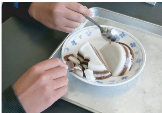
図8. 寒天で作った地層モデル。

「断層」や、「地層の広がり」の概念を学習するために寒天で作ったモデルを用いて授業を行った。これは「なぜずれた地層があるのか」、「地層はいろいろなところに広がっていないのか」という疑問をもとに展開した。