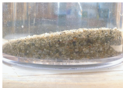
図7. グランドの土を流して作った地層の様子。

「どのように地層ができたのか」という疑問に対して、阿多岐層を思い出させた。阿多岐地区は昔大きな湖であったこと、珪藻の死骸がたまって珪藻土となっていることから、「水の中に土が積もった」ということを考えさせた。そこから「湖の中にどのように地層ができるのか」という疑問が生まれ、「水のはたらきによって形成される地層」がどのようにできるかモデル実験を行った。