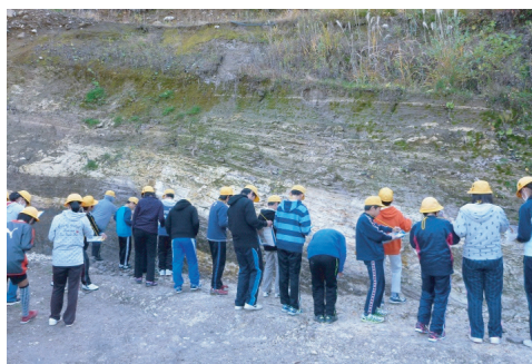
図6. 露頭観察の様子。

地層観察は、2014年11月10日に行った。学校から露頭まではマイクロバスを使用し、移動時間は40分であった。児童はワークシートに示されている事象が露頭のどこにあるかを探した(図6)。